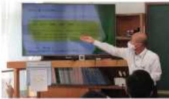
令和2年10月27日(火) 高校の先生に学ぶ講演会

高校選択のところに、「看護科は部活との両立が難しい」とあったので困ってしまっていたが、自分の選んだ道を進んで行こうと思う。そして私の心に刺さった言葉は「人間力」と「心の在り方」がその人の「伸びしろ」を決めると言う言葉。自分自身、もっと「志」「努力」「感謝」「謙虚」「素直」を持ち続け、自分自身を高めてきたいと強く思った。