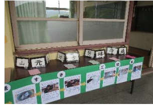
2年紙すきはがき作り