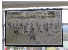
3年モザイクアート