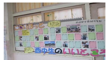
生徒会活動(保体部)

限られた時間の中、各学年がそれぞれ工夫を凝らして作品制作に取り組みました。生徒一人一人が作品作り真剣に向き合う姿や割り当てられた役割を精一杯果たそうとする様子が印象に残った文化祭でした。生徒のみなさん、おつかれさまでした。